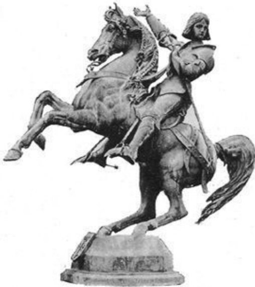
SAINTE JEANNE D'ARC EN ARMURE À CHEVAL