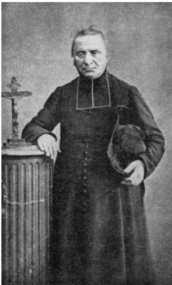
PÈRE L.-E. CESTAC

Éditions Saint-Remi BP 80 – 33410 CADILLAC 05 56 76 73 38 www.saint-remi.fr