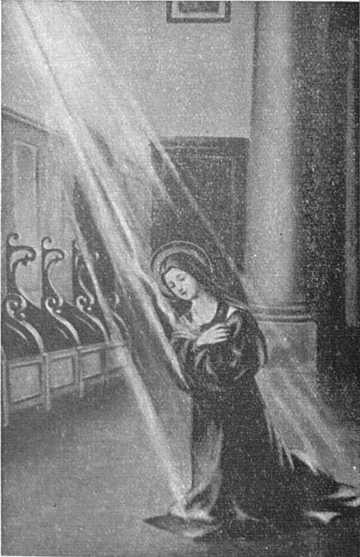
SAINTE THÉRÈSE DE L'ENFANT-JÉSUS DIVINEMENT BLÉSSÉ D'AMOUR APRÈS SON ACTE D'OFFRANDE À L'AMOUR MISÉRICORDIEUX